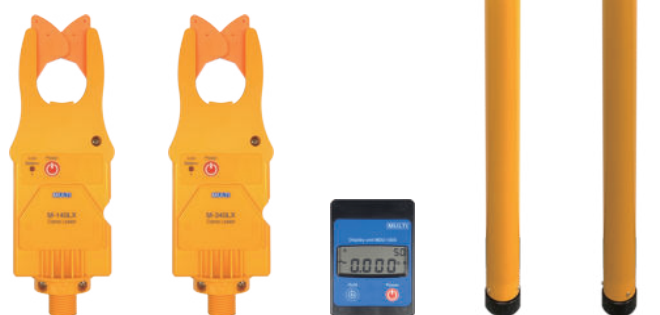
M-140LX-CT M-340LX-CT MDU-100X MLX-5P MLX-6P